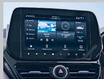
WIRELESS SMARTPLAY PRO+