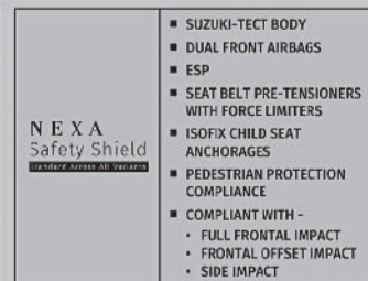
NEXA Safety Shield