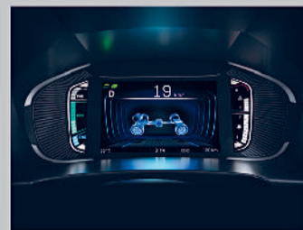
DIGITAL MULTI-INFORMATION DISPLAY